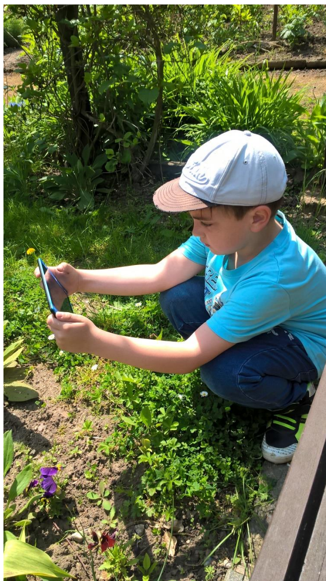
Sdružení Tereza – Tajný život města