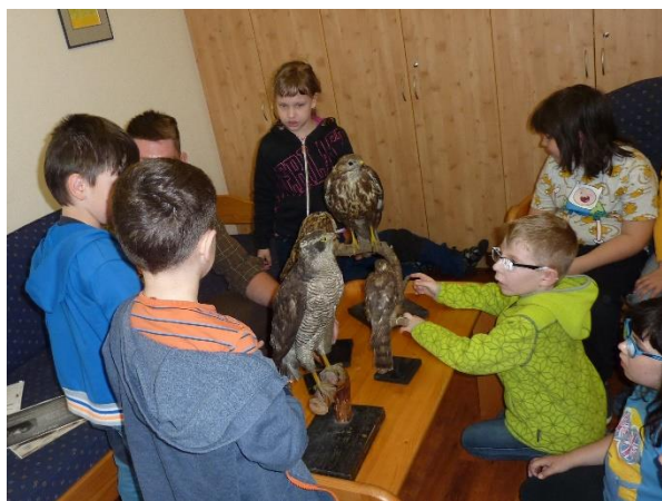
LS ČR - Ptačí svět

Děti MŠ vystoupily s kulturním programem v Domově seniorů v Rakovníku.