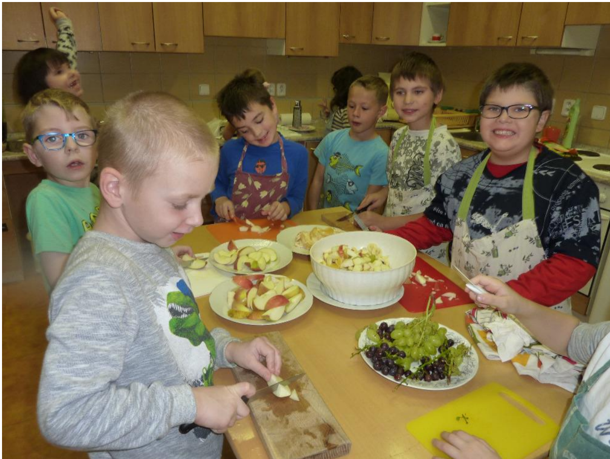
Den zdraví – 1.L příprava ovocného salátu