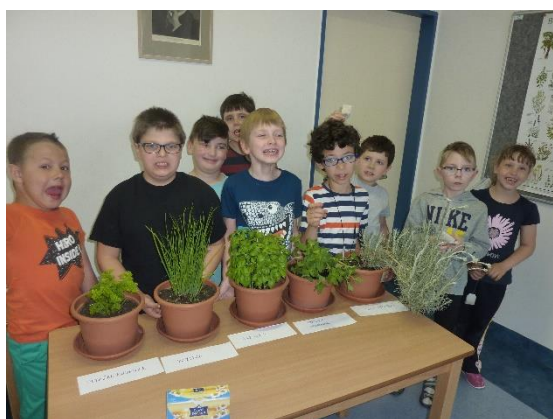
Bylinky – 1.L poznávání, ochutnávání

K tomuto tématu se již pravidelně konají dny věnované správné výživě v rámci prevence patologických jevů. Žáci si při Dni zdraví připomínají zásady správné výživy, potřebu pravidelného pohybu a zkusí si také přípravu zdravého pokrmu.