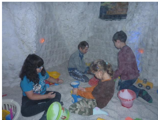
Solná jeskyně – 1.L zdravý životní styl