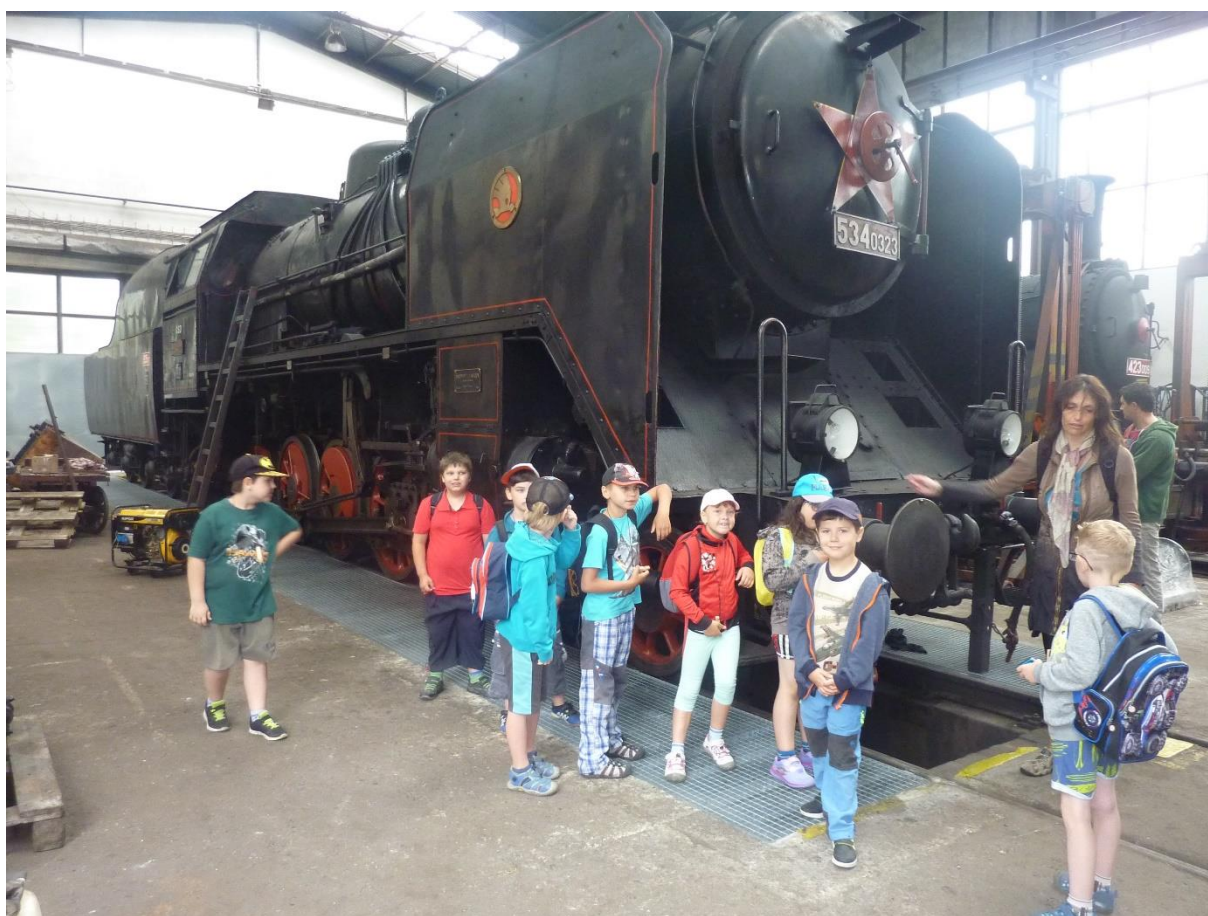
Železniční muzeum Lužná – 1.L poznávání reálií Rakovnícka

Za poznáváním středočeského regionu vyjeli žáci ZŠ speciální na pobytový kurz EVVO do NSEV Kladno Čabárna. Hodnocení tohoto kurzu je součástí zprávy v příloze. Hodnocení vypracovala Mgr. Alena Vožehová.