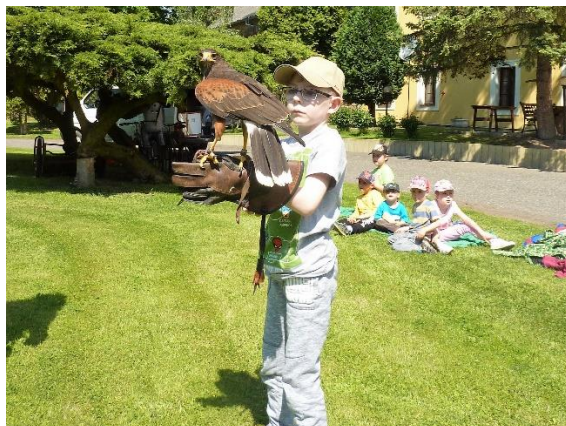
DD Kolečovice – Dravci