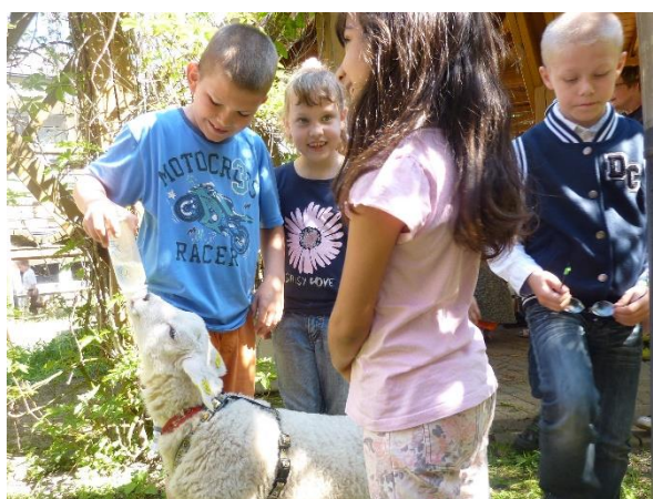
Farma Oplt – Jehňata v atriu