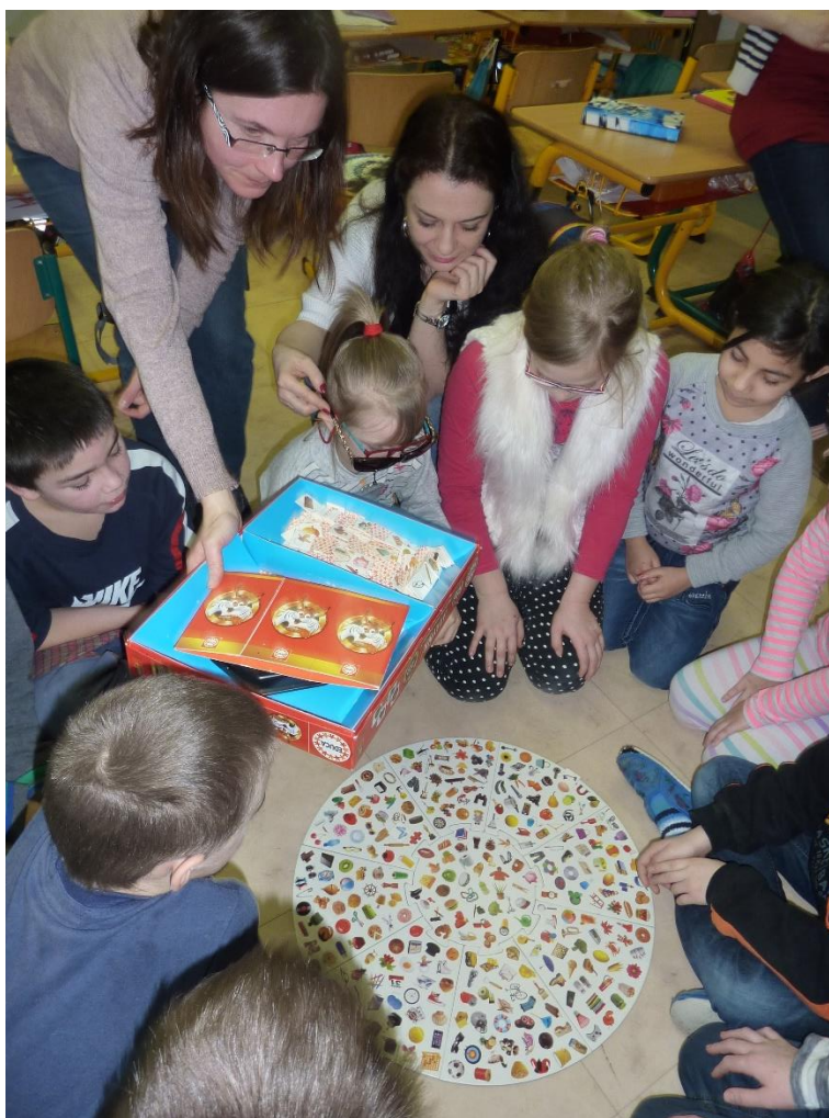
DD Kolečovice – 1.a 2.roč. ZŠp hra pro seniory

Během dvou let, kdy jsou na naší škole děti s vadami řeči, se výrazně zlepšila komunikace a spolupráce s rodiči těchto žáků. Rodiče mají zájem o prospěch a chování svých dětí, zapojují se do školních aktivit, řeší případné problémy s vyučujícími. Napomáhají tak rozvíjet správné osobnostní postoje dětí.